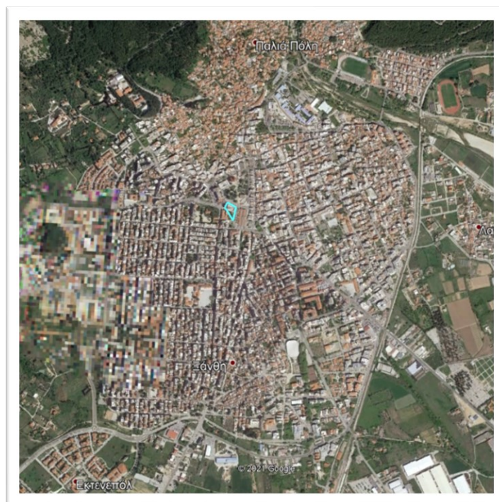
Εικόνα 1: Αεροφωτογραφία της πόλης της Ξάνθης- Επισημαίνεται η θέση του οικοπέδου

Το κλειστό αμφιθέατρο που διαθέτει το κτίριο, είναι το μοναδικό κλειστό αμφιθέατρο της πόλης και λειτουργεί ανελλιπώς έως και σήμερα. Σε αυτό διοργανώνονται βραδιές λαογραφίας με παραδοσιακούς χορούς από ελληνικά και ξένα συγκροτήματα, θεατρικές παραστάσεις από τοπικά ερασιτεχνικά σχήματα ή θιάσους για μικρούς και μεγάλους, επιδείξεις χορού από σχολές της Ξάνθης (δημόσιες ή ιδιωτικές) ή άλλα σχήματα, εκδηλώσεις (ομιλίες, παρουσιάσεις βιβλίων και εορτασμοί) και συναυλίες με όλα τα είδη της μουσικής.