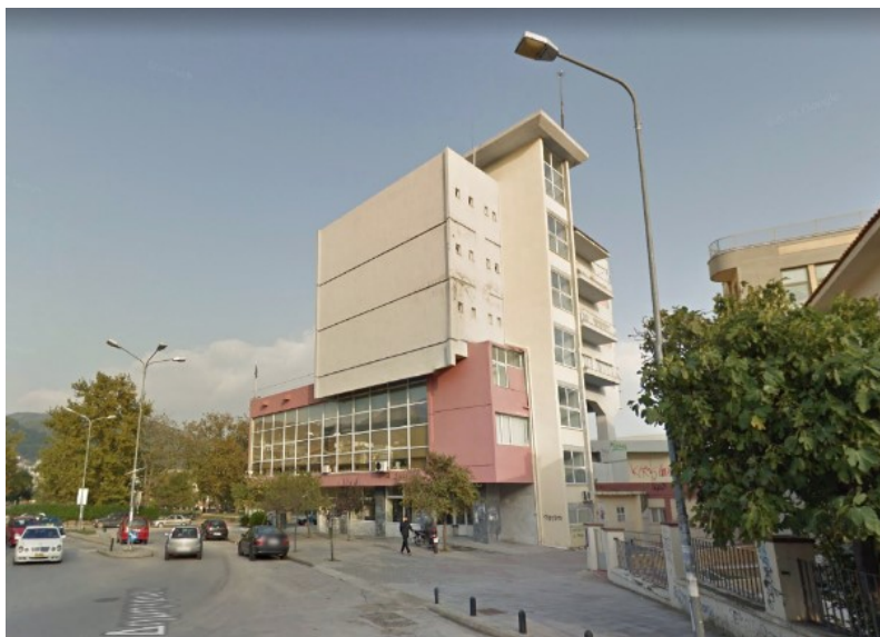
Εικόνα 3: Δυτική όψη