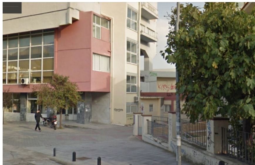
Εικόνα 4: Νοτιοδυτική όψη