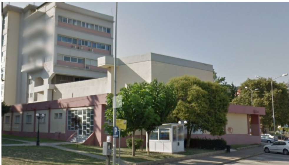
Εικόνα 5: Νότια όψη