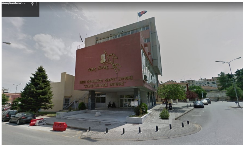
Εικόνα 1: Βόρεια όψη