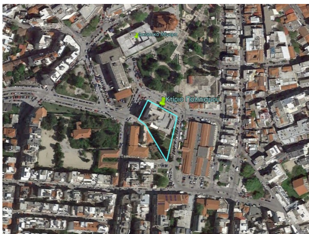
Εικόνα 2: Αεροφωτογραφία της περιοχής

Το κτίριο δεν είναι χαρακτηρισμένο ως μνημείο ή διατηρητέο ή παραδοσιακό.