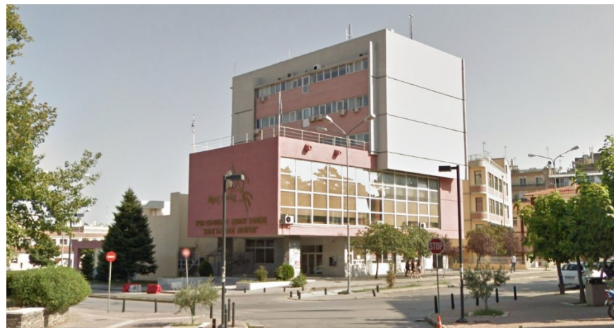
Εικόνα 2: Βορειοδυτική όψη