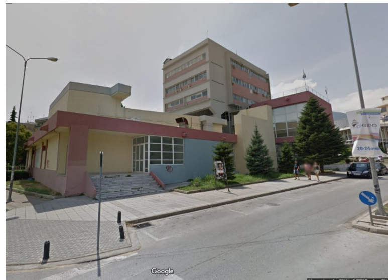
Εικόνα 6: Ανατολική όψη