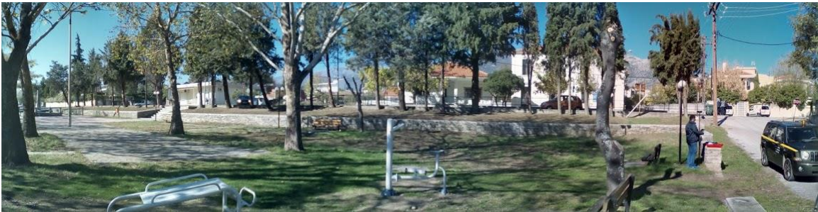
Πανοραμική φωτογραφία περιοχής επέμβασης.