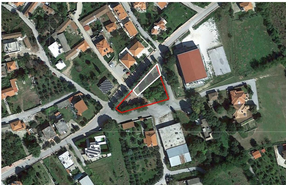
Ορθοφωτογραφία περιοχής επέμβασης.