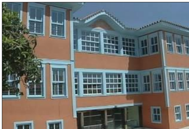
Εικόνα: Το Κονάκι του Μουζαφέρ Μπέη μετά από την αποκατάσταση