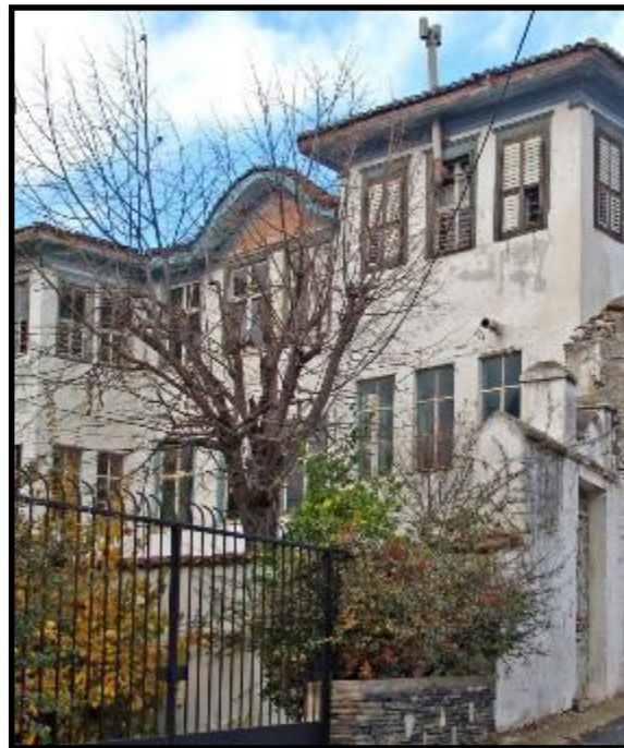
Εικόνα: Το κονάκι του Μουζαφέρ Μπέη σε φωτογραφία του 2006, πριν από την αποκατάσταση (δεξιά)