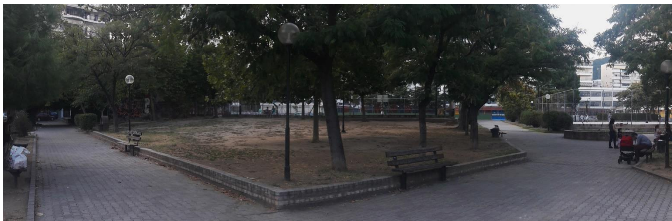
Πανοραμική φωτογραφία περιοχής επέμβασης.