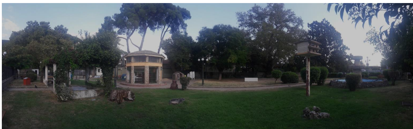
Πανοραμική φωτογραφία περιοχής επέμβασης.