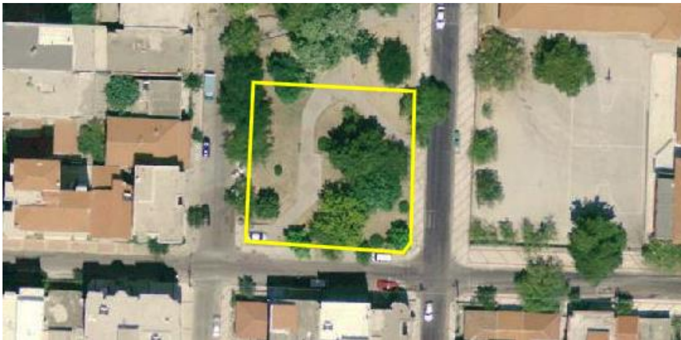
Αεροφωτογραφία περιοχής επέμβασης.