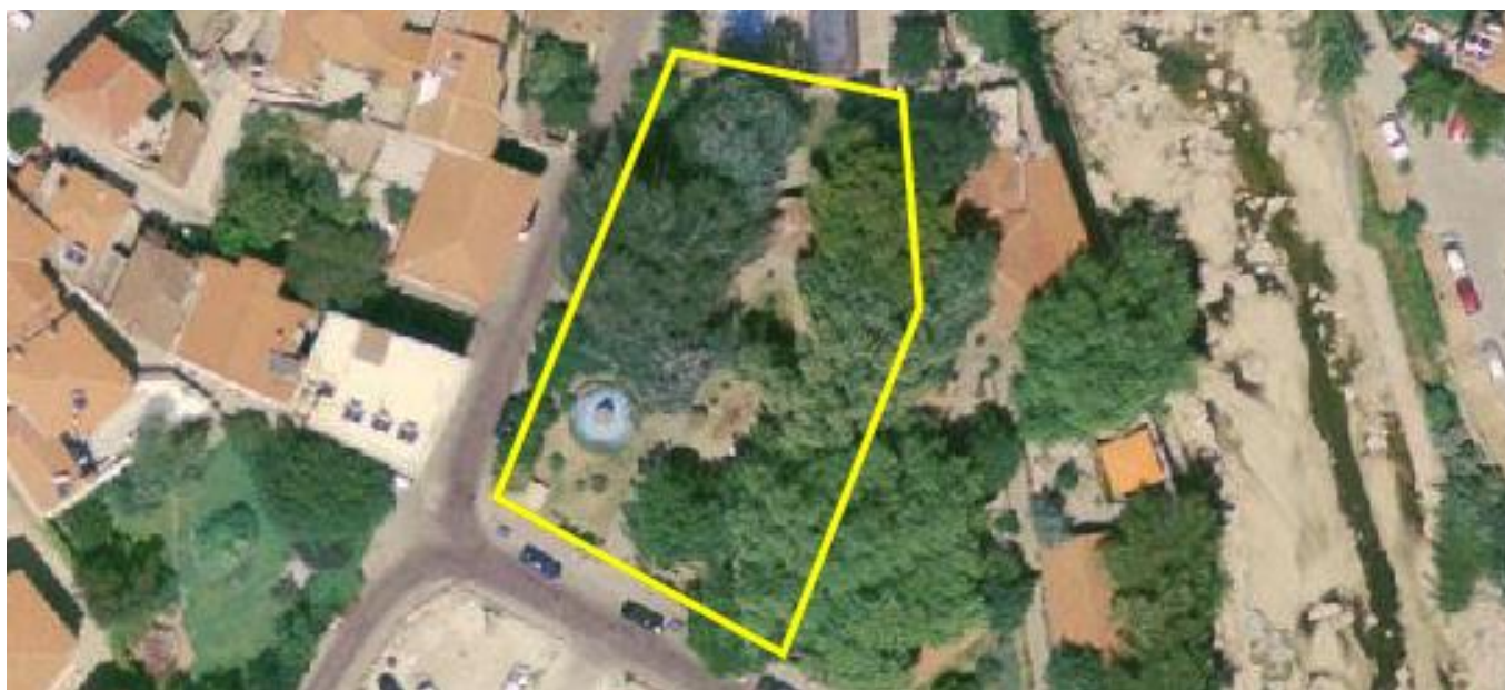
Αεροφωτογραφία περιοχής επέμβασης.