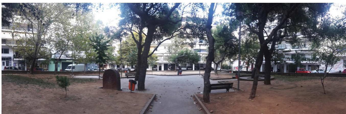
Πανοραμική φωτογραφία περιοχής επέμβασης.