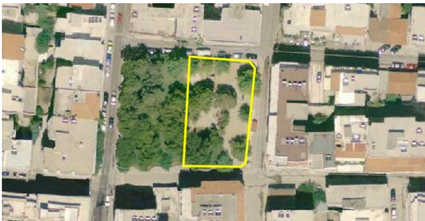
Αεροφωτογραφία περιοχής επέμβασης.