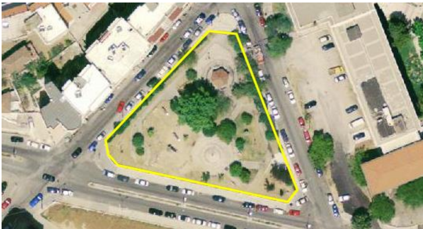
Αεροφωτογραφία περιοχής επέμβασης.