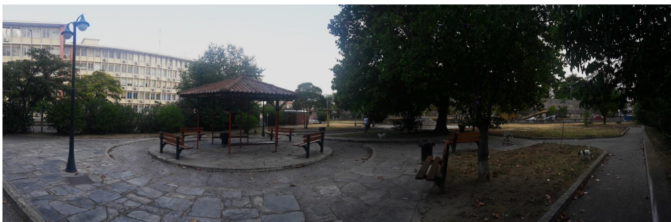
Πανοραμική φωτογραφία περιοχής επέμβασης.